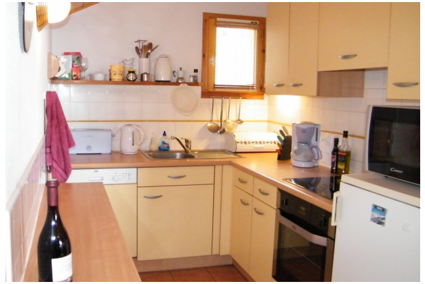
Table de cuisson induction - Toutes les plaques sont à induction.

Lave Vaisselle - Il suffit de mettre une tablette et tournez cadran pour le réglage de 30 minutes et appuyez sur le bouton "triangle". Svp rincez les assiettes très sales car il n'y a personne pour nettoyer le panier de filtre - MERCI